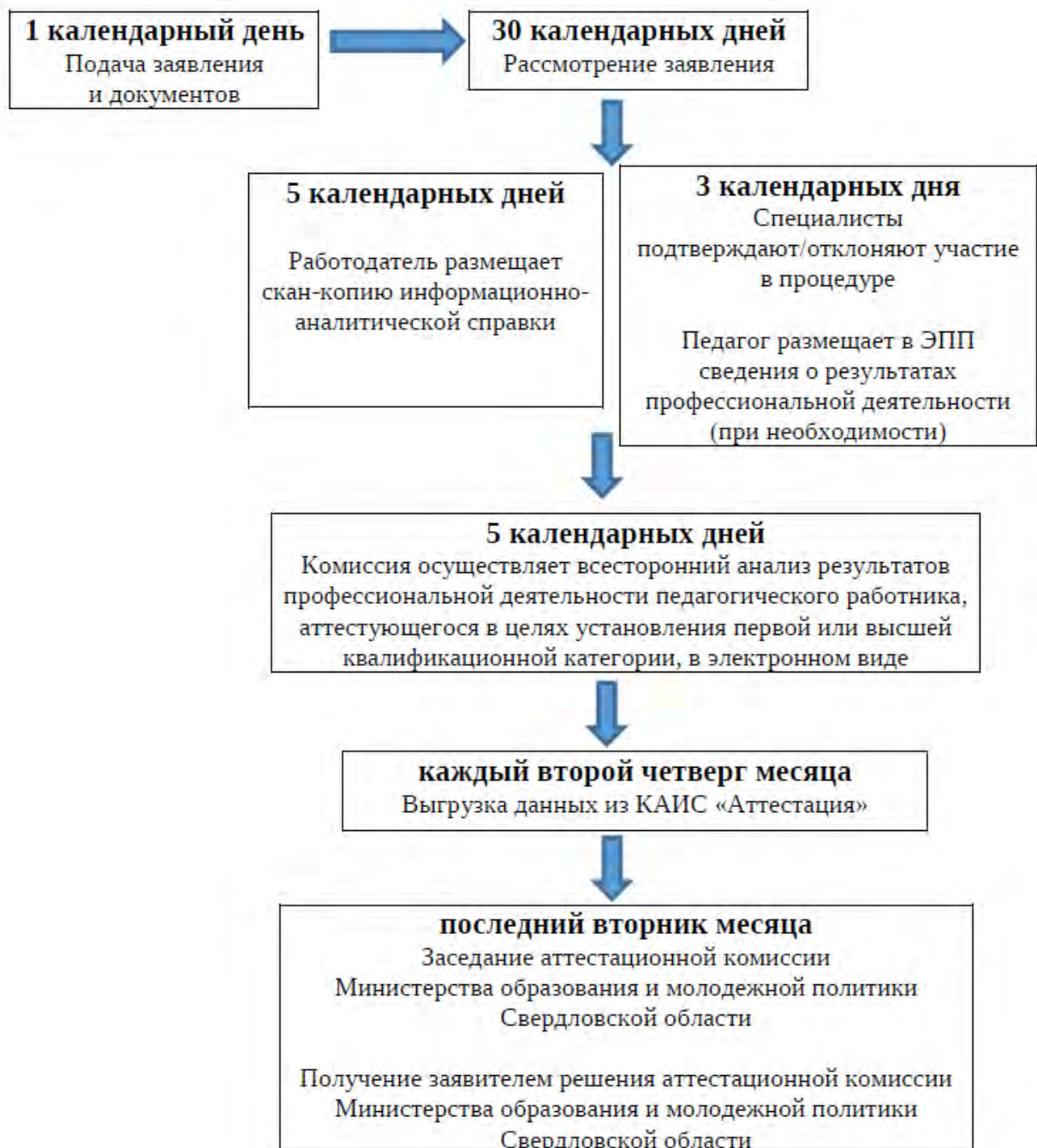
Схема процесса оказания государственной услуги в электронном формате и сроки выполнения всех действий представлены на рисунке. Педагог подает заявление и получает результат оказания госуслуги (решение АК). Выполнение последующих действий обеспечивает и контролирует КАИС ИРО (модуль «Аттестация»).